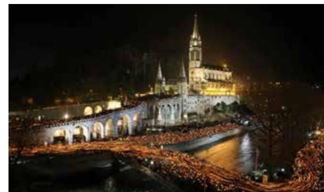
Procesión de las antorchas

Por la mañana dispondrá de tiempo para completar la visita de Lourdes que podrá alternar con excursión facultativa a las impresionantes Grutas de Bétharram que se visitan en tren y en barca por su lago subterráneo. Almuerzo en el Hotel y regreso hacia nuestra Terminal.