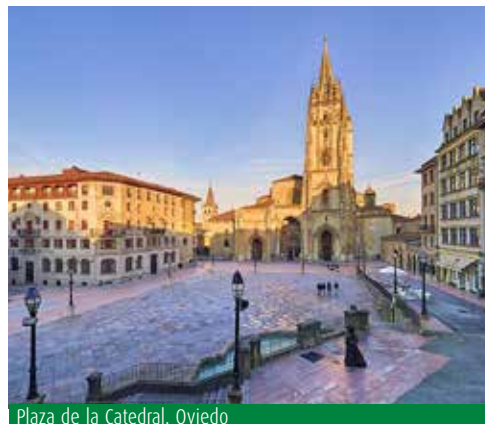
Plaza de la Catedral. Oviedo

Salida de nuestro Hotel y emprendemos nuestra ruta de regreso por autopista. Almuerzo en un Restaurante de nuestra ruta. Finalizaremos la jornada llegando a tierras catalanas hasta nuestro origen.