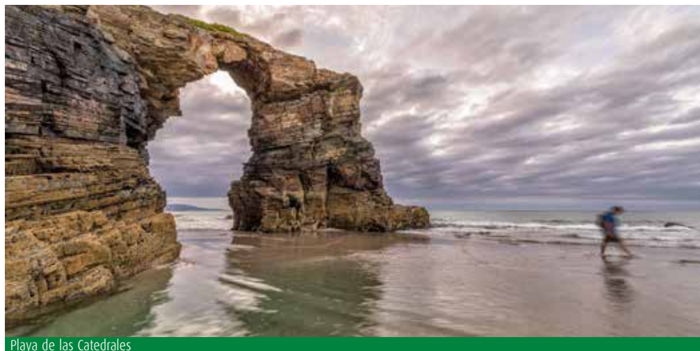
Playa de las Catedrales

Excursión por la costa occidental de Asturias hasta el límite con Galicia. En la costa de Lugo, aprovechando su marea baja, visitaremos la célebre Playa de las Catedrales . Sin lugar a dudas, es una de las playas más bonitas de la cornisa cantábrica. Ya en territorio gallego esta playa declarada Monumento Natural, es conocida mundialmente por sus formaciones rocosas creadas por el viento y el agua, que han llevado a crear curiosas formas que corren a cargo de la imaginación del visitante. Cuando baja la marea es posible descalzarse y caminar bajo cuevas de gran altura y descubrir arcos dentro de otros arcos. En Ribadeo atravesaremos el moderno "Puente de los Santos", de 612 metros de largo, que une Galicia con Asturias, con bellas vistas que ofrece la desembocadura del Eo. Almuerzo en Restaurante. Por la tarde pararemos en Cudillero , un pequeño y pintoresco puerto de pescadores enclavado en la ladera de una montaña. Destacan sus casas colgantes con aleros y ventanas de vivos colores que se sitúan en una abrupta herradura de acantilados alrededor del puerto. Sus dos construcciones más importantes son la iglesia parroquial de estilo gótico que data del siglo XVI, en la que se pueden admirar tallas barro-